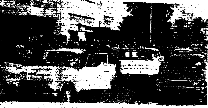
نظارة السيارات لزارعي التبغ الشمال عند وصولها الى سراي طرابلس